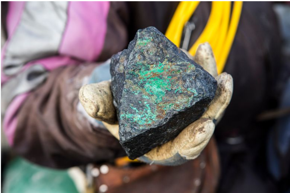
Forekomsten av kobber i fjellene er årsaken til den planlagte gruvedriften.

Analysen skal ha blitt laget på oppdrag fra Sametinget og blitt kombinert tradisjonell reindriftskunnskap, opplyses det.